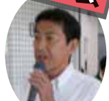
丸山本庄税務署長