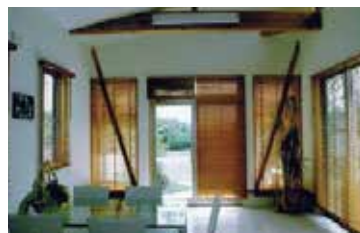
ガラス面の多い明るく涼しげな応接室