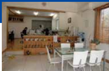
区切りのない開けた事務所