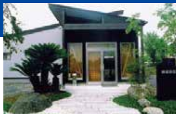
洗練された正面外観