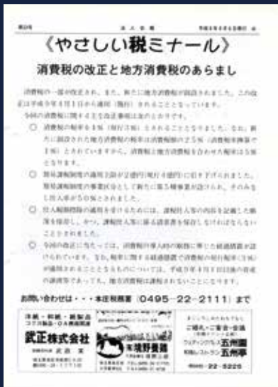
平成8年9月 消費税 5%へ