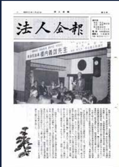
昭和50年1月 創刊三号