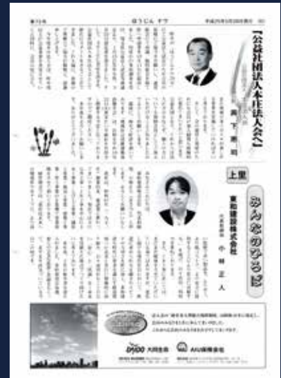
平成25年5月 公益社団法人会化