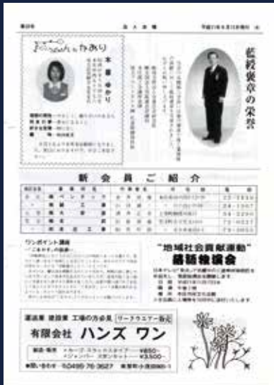
平成11年9月 地域貢献活動第一回爆笑会開催