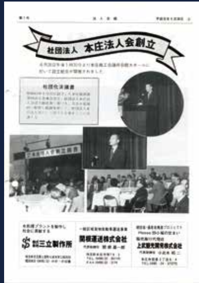
平成元年5月 社団法人本庄法人会設立